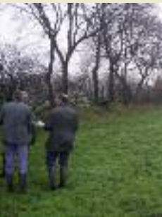
Vertreter der Bewertungskommission; © Reiner Janssen, UNB Wittmund