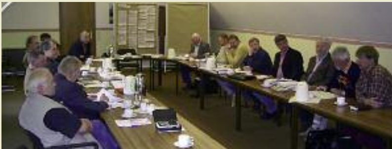
In der Kooperationsgruppe entwickelten Vertreter von Landwirtschaft und Naturschutz die Grundlagen; © Eckard Asche