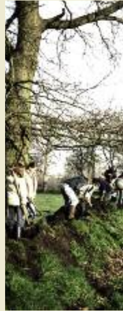
Eine Schulklasse pflanzt Sträucher – für viele Schüler ein tolles Erlebnis; © Schutzgemeinschaft Wallheckenlandschaft Leer e.V.

Die Ostfriesische Landschaft unterstützt die Wallheckenbewirtschafteter bei der Beschaffung von Gehölzen regionaler Herkunft.